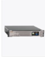
neXus AiIoT FXE Server