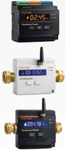
Fotec Fluxsense Ürünleri