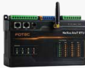
Fotec neXus AiIoT RTU Ürünleri