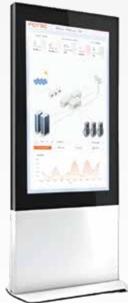
Fotec Fsign Ekran