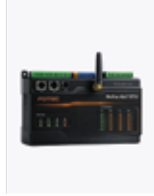
neXus AiIoT RTU